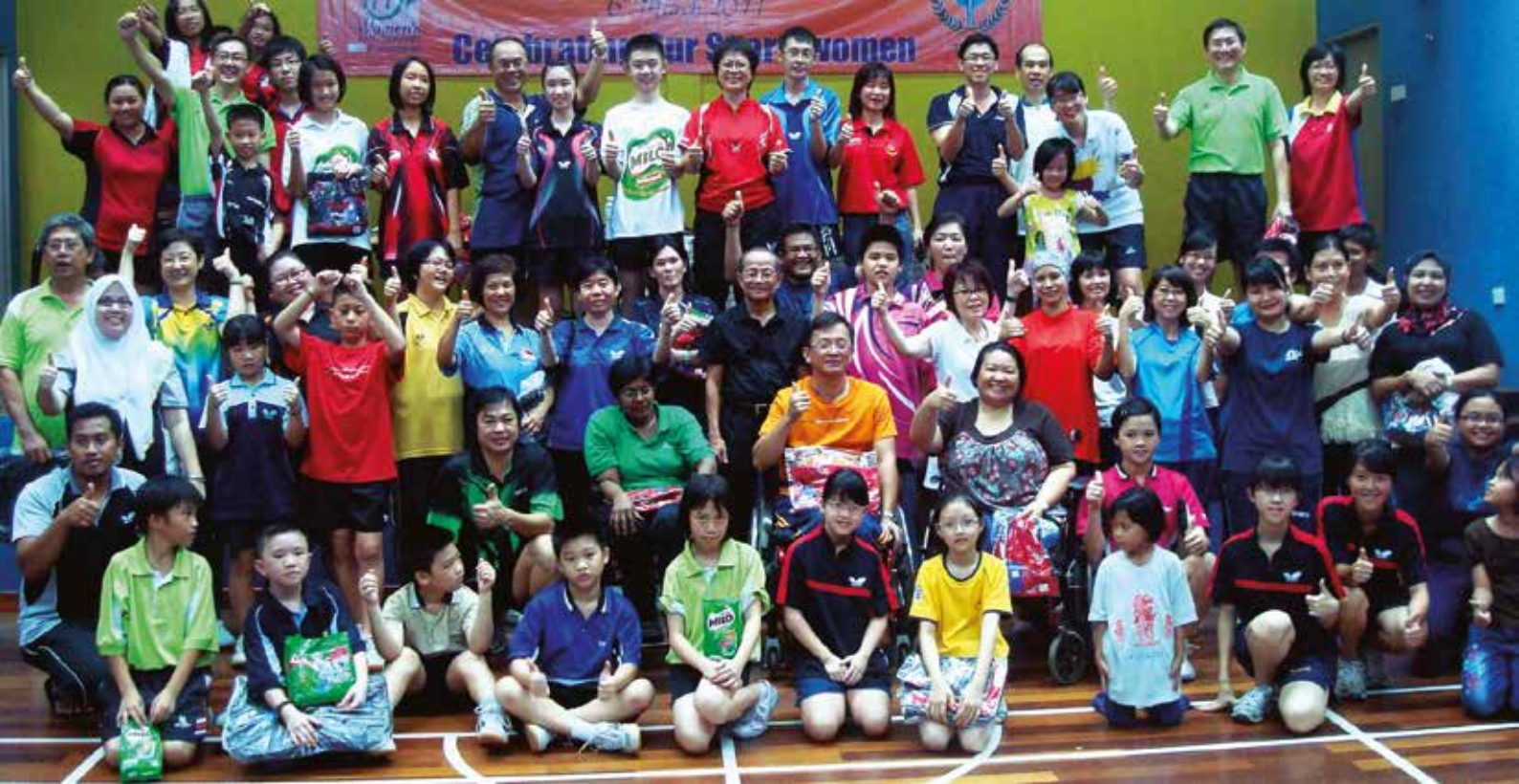
TÊNIS DE MESA PARA TODO MUNDO, EM TODA PARTE